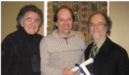
Les récipiendaires du prix Innovation

Dans le bulletin du mois dernier, nous annonçons les deux prix Innovation et Recherche reçus par l'équipe du bureau de la formation professionnelle continue décernés par le Conseil de développement professionnel continu du collège des médecins du Québec. Ce mois-ci nous associons l'image au texte avec les photos des récipiendaires !